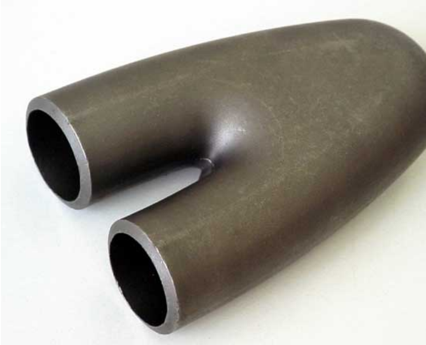
Umkehrende für Dampfloküberhitzerrohre Präzisionsguss aus warmfestem Stahl (16CrMo4)

Freitag, den 19. Dezember 2008 um 11:12 Uhr - Aktualisiert Donnerstag, den 26. Februar 2009 um 16:23 Uhr